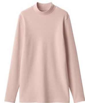
あったか綿 ウール