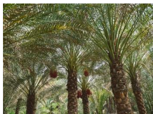
なつめやし(デーツ) イメージ

Gallery では、「地に根付く知恵、実りを未来につなぐ文化の循環 なつめやし デーツ」というタイトルで中東で広く栽培されているなつめやし（デーツ）と砂漠のオアシスとのつながりを模型や画像で展示するほか、彼らが主宰する、文化の共融点を観察するメディア「BrownBook」のこれまで発行されたバックナンバー展示や二人のインタビュー動画を投影します。